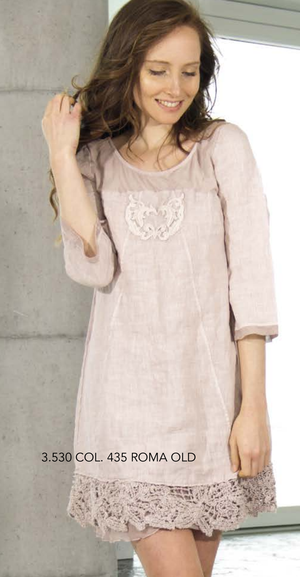
3.530 COL. 435 ROMA OLD