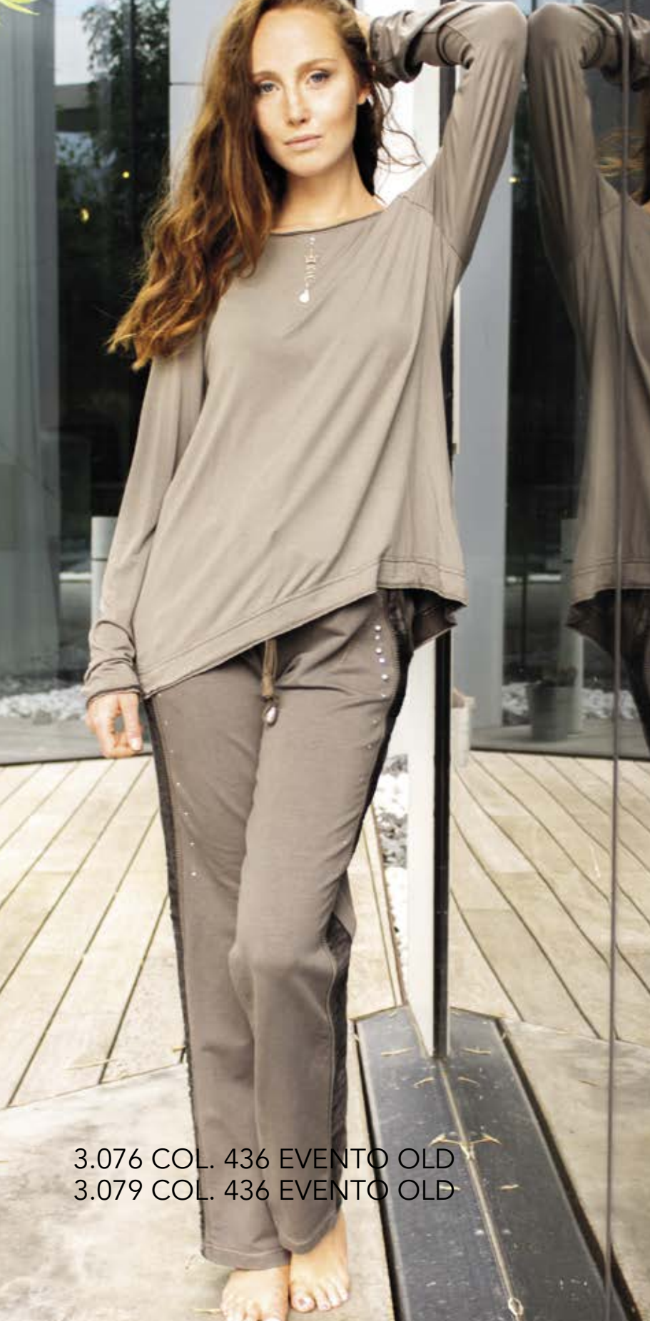
3.076 COL. 436 EVENTO OLD 3.079 COL. 436 EVENTO OLD