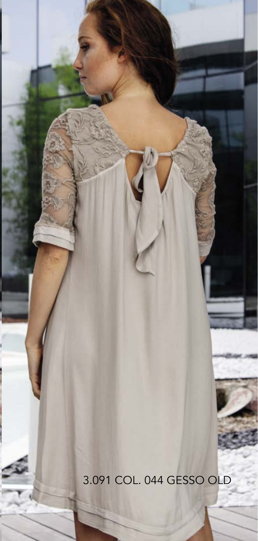
3.091 COL. 044 GESSO OLD