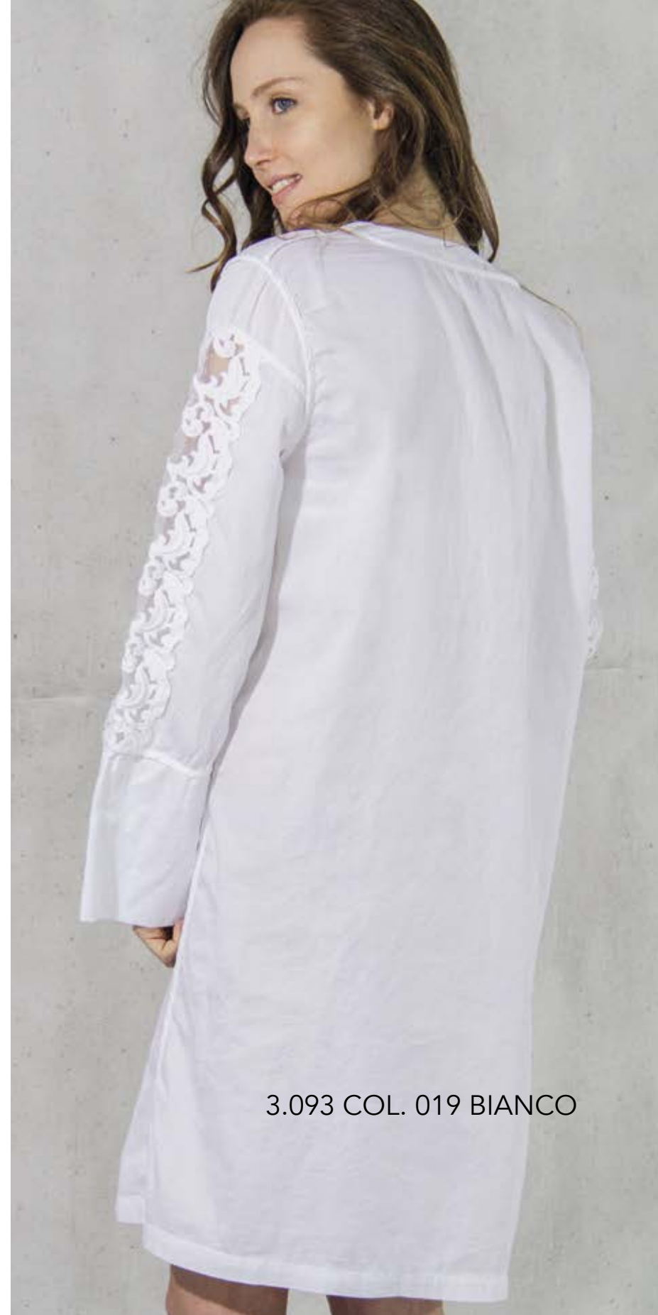
3.093 COL. 019 BIANCO