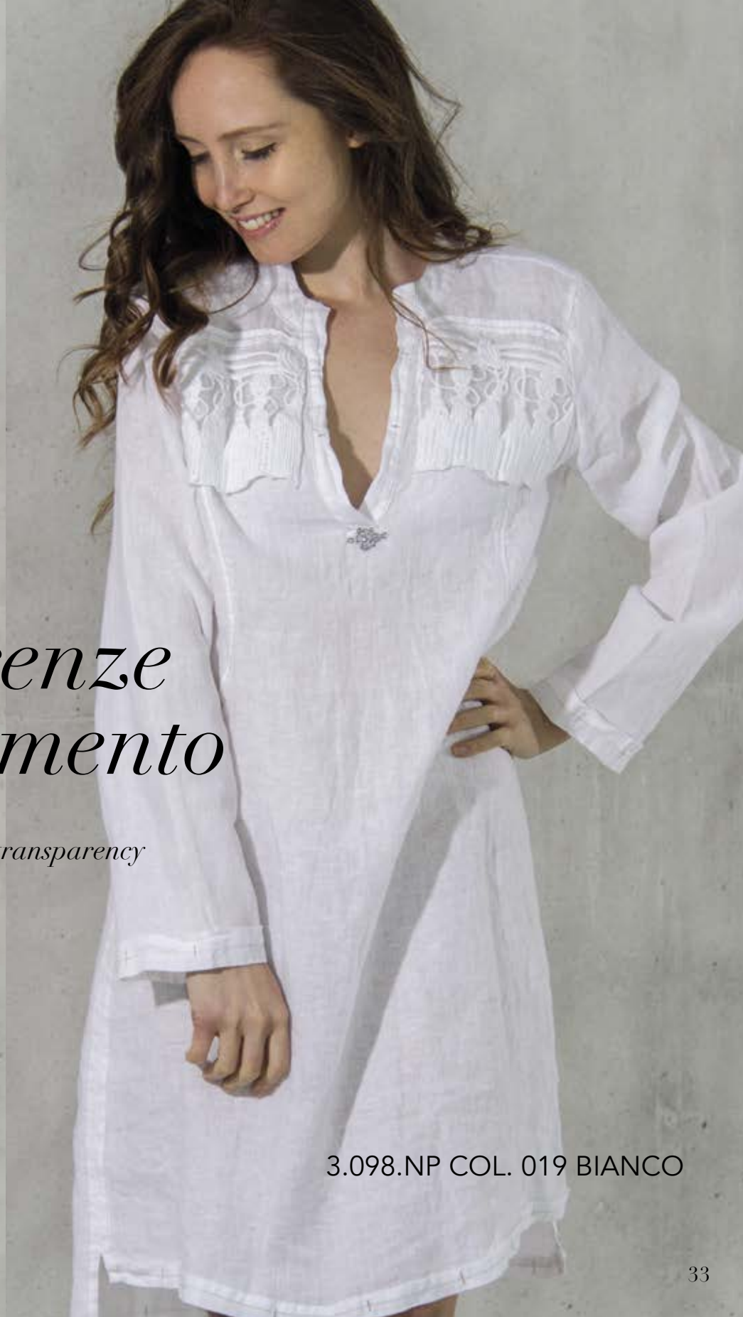
3.098.NP COL. 019 BIANCO