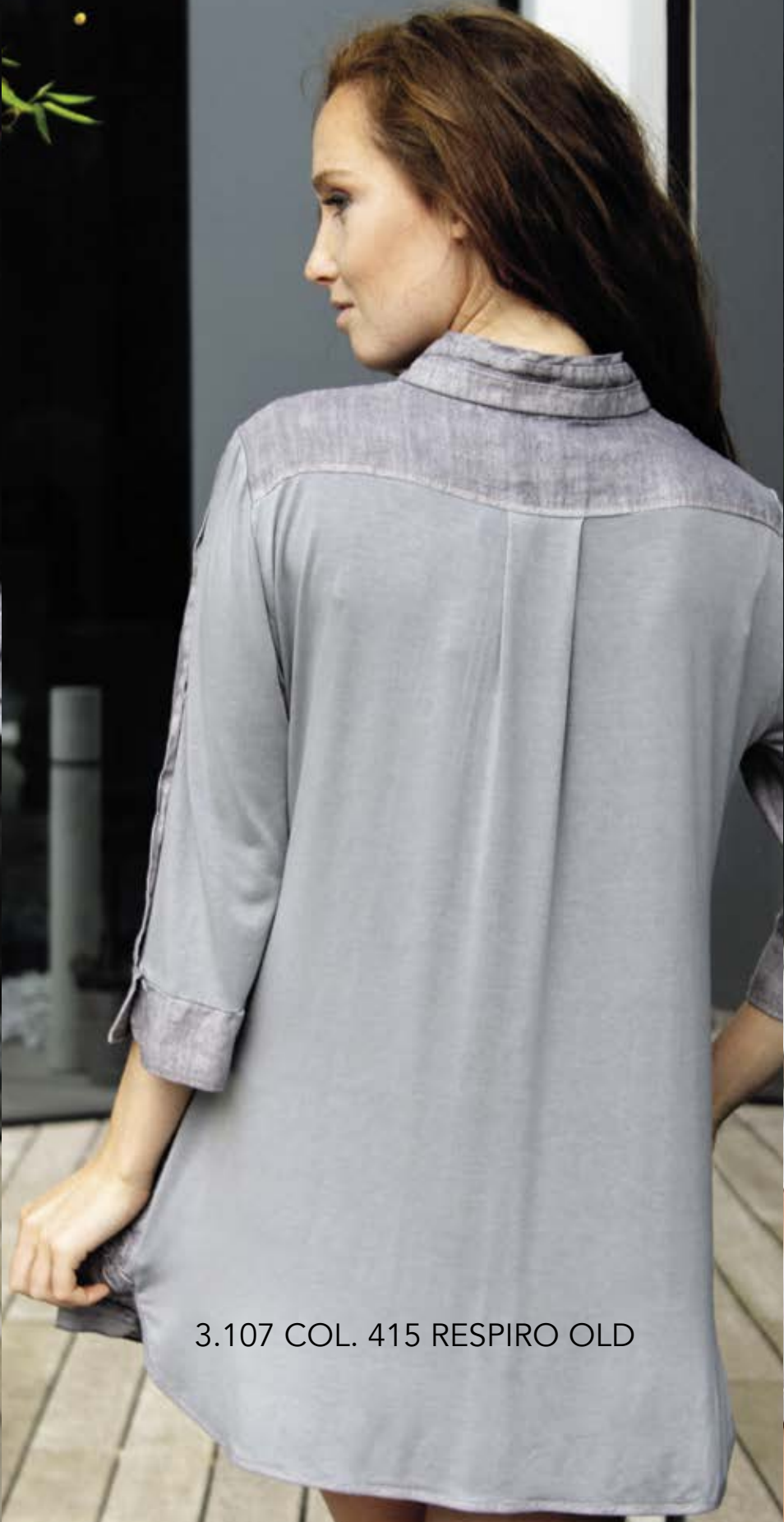
3.107 COL. 415 RESPIRO OLD