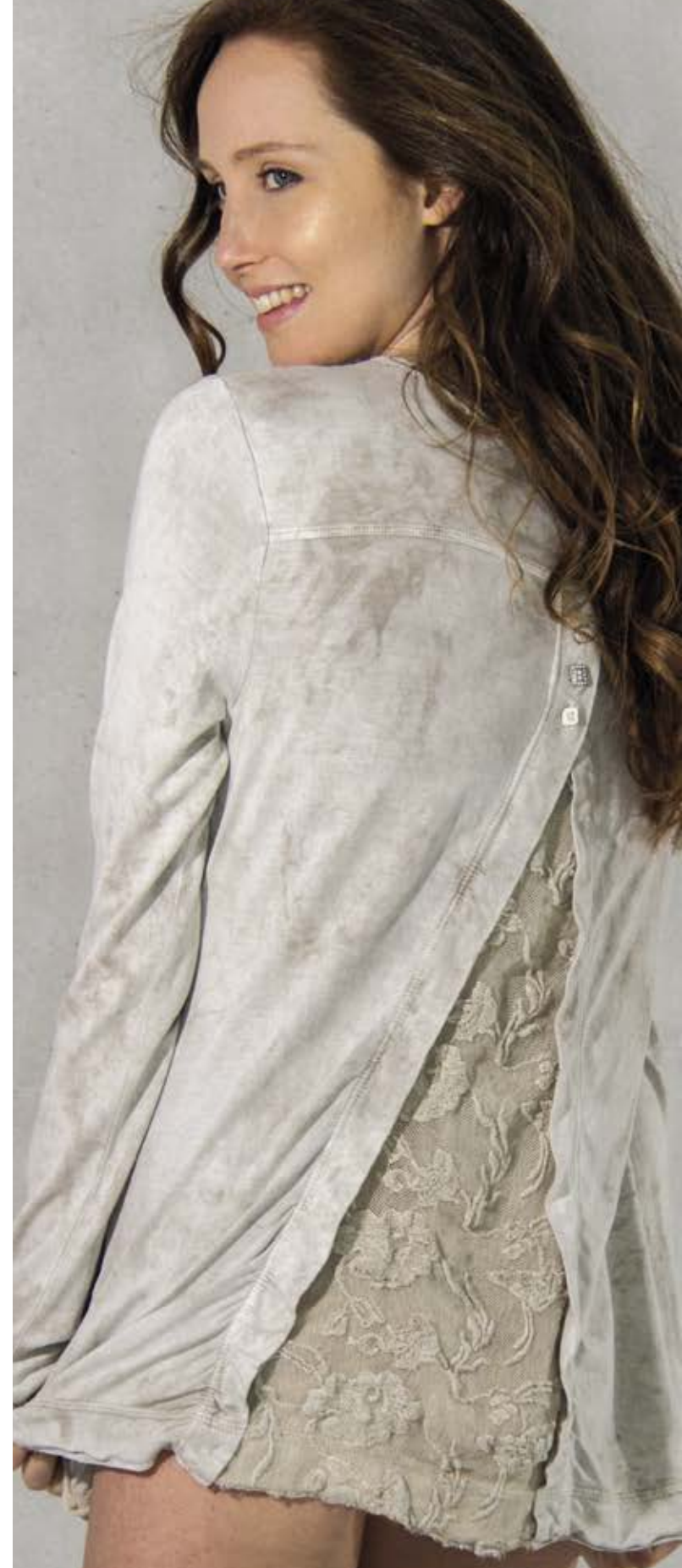
3.079 COL. A01 LUNA