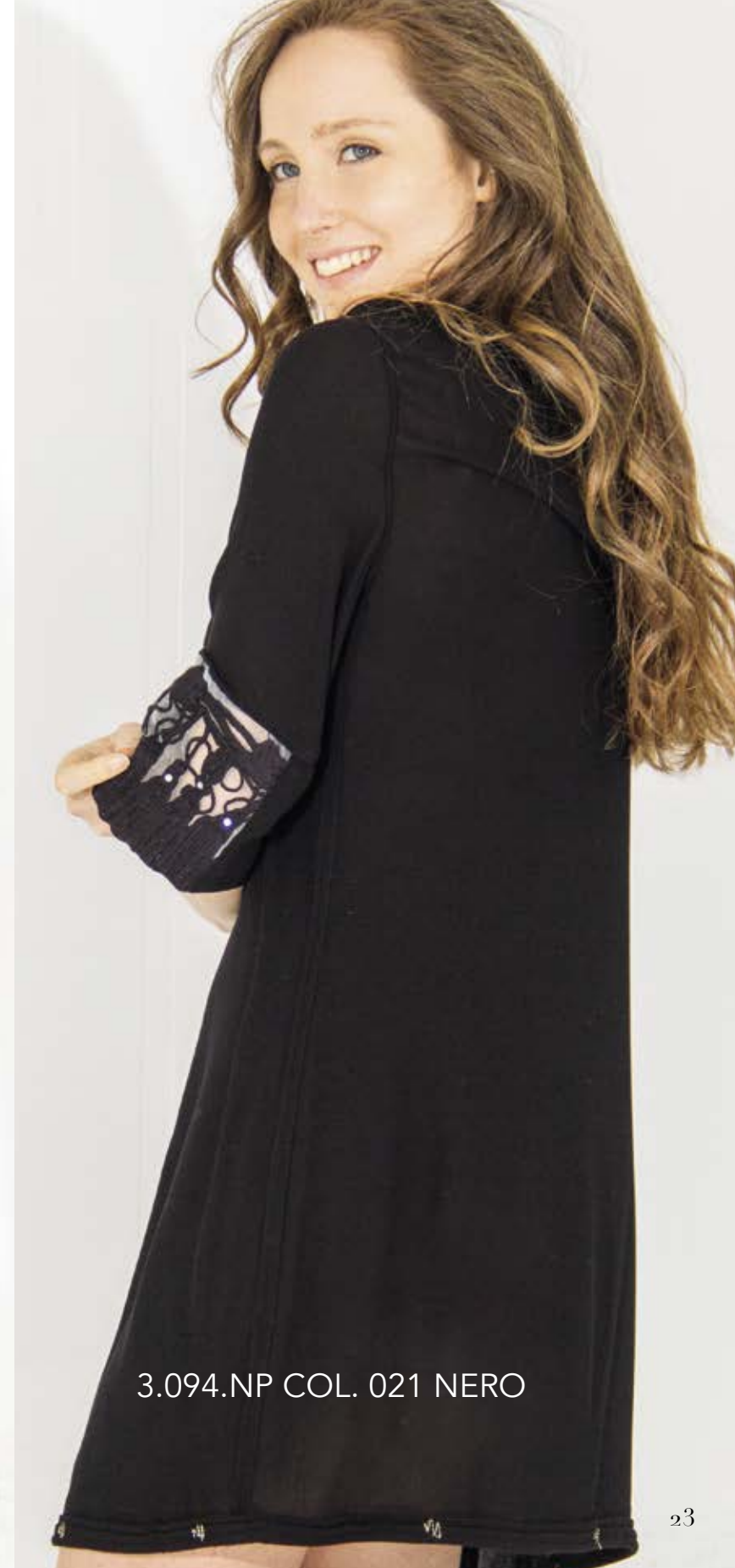
3.094.NP COL. 021 NERO