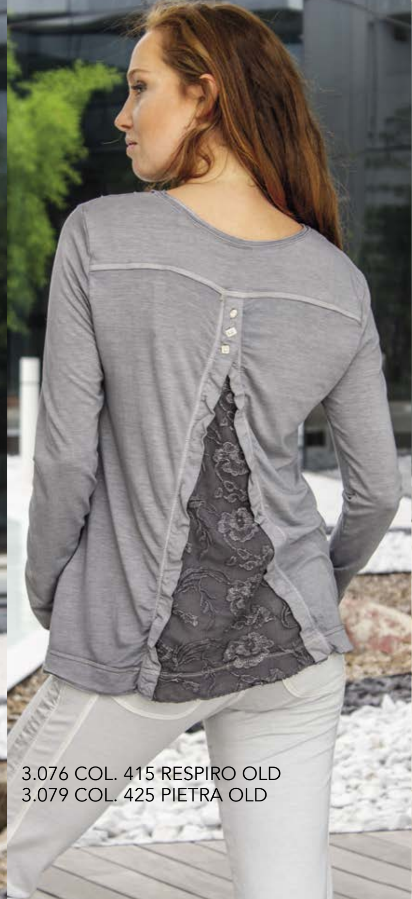
3.076 COL. 415 RESPIRO OLD 3.079 COL. 425 PIETRA OLD