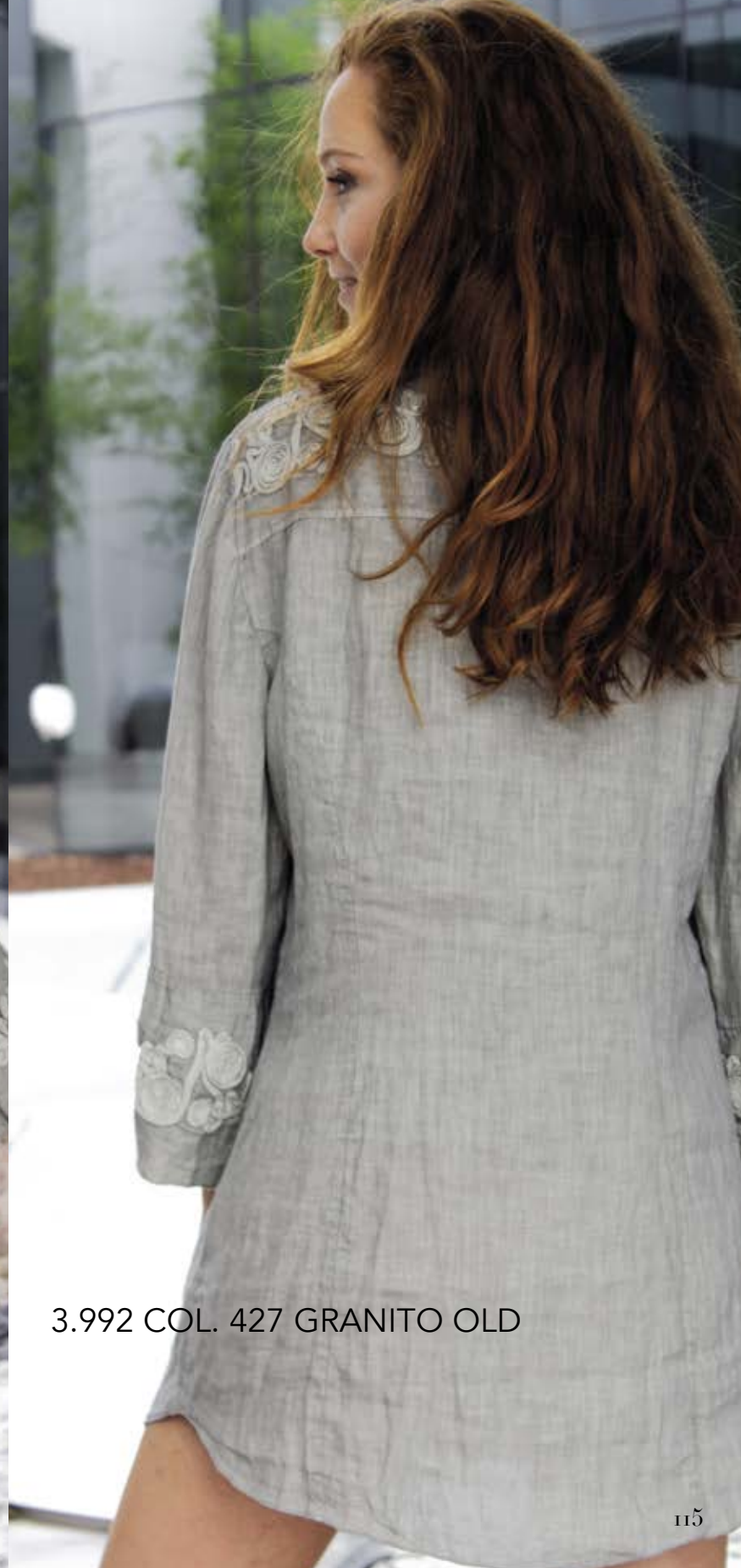
3.992 COL. 427 GRANITO OLD