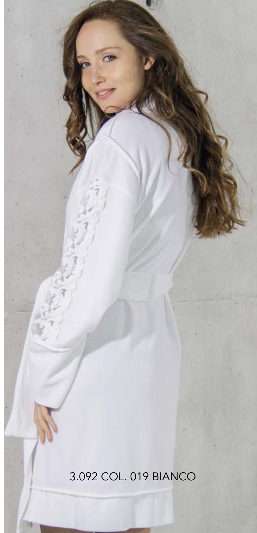
3.092 COL. 019 BIANCO