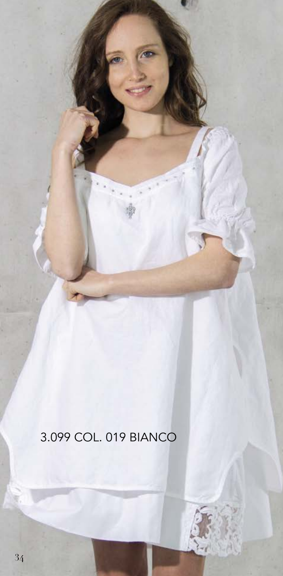
3.099 COL. 019 BIANCO