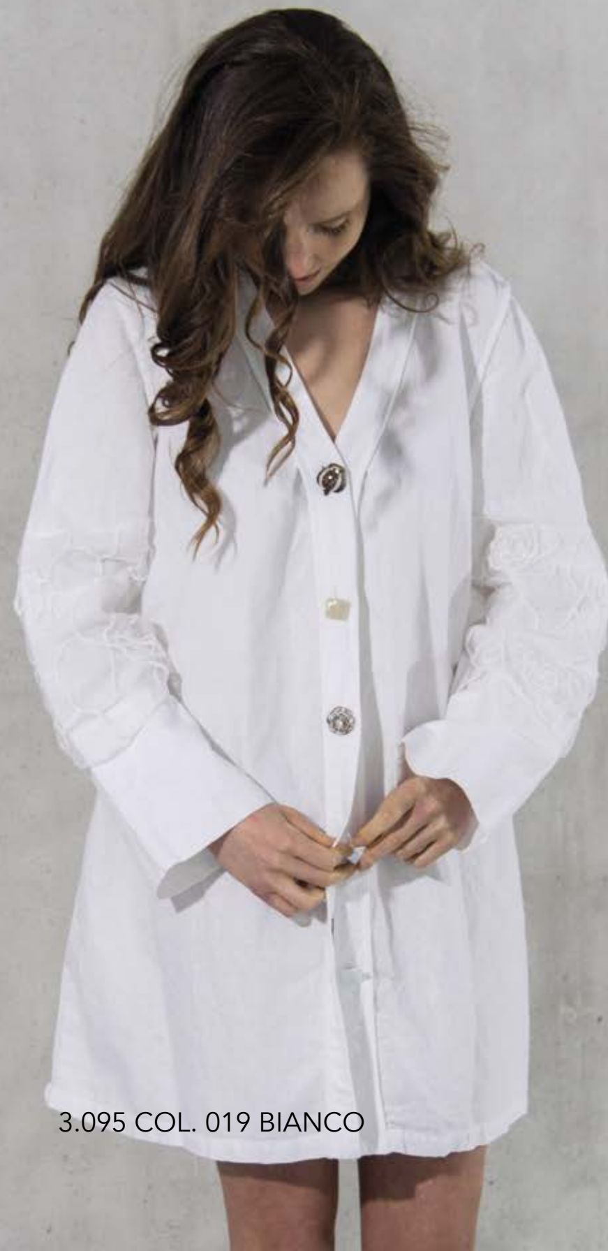
3.095 COL. 019 BIANCO