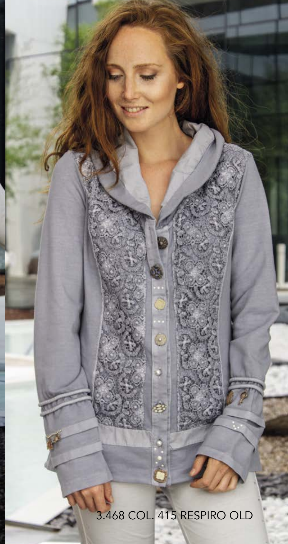
3.468 COL. 415 RESPIRO OLD