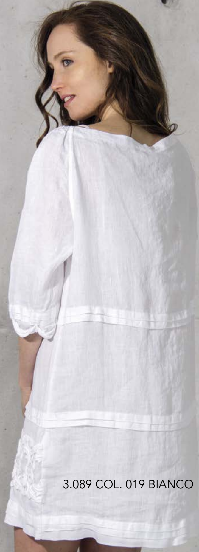
3.089 COL. 019 BIANCO