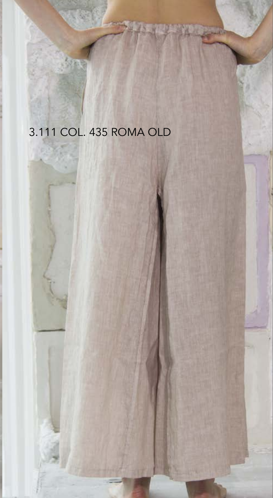
3.111 COL. 435 ROMA OLD