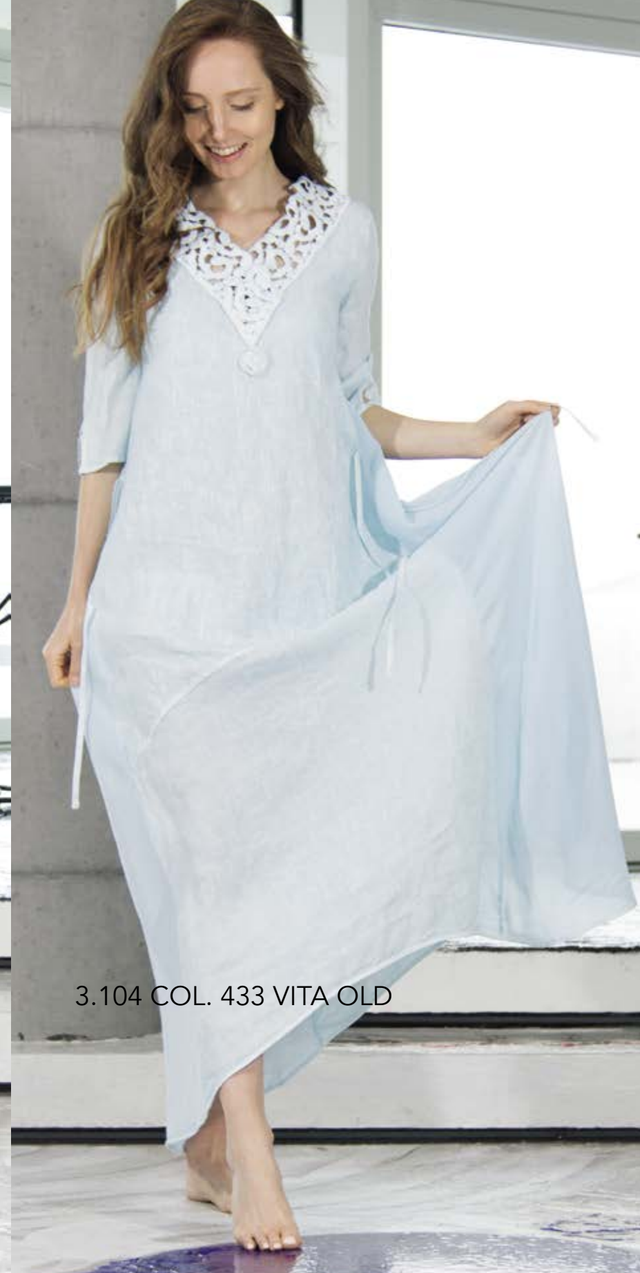
3.104 COL. 433 VITA OLD