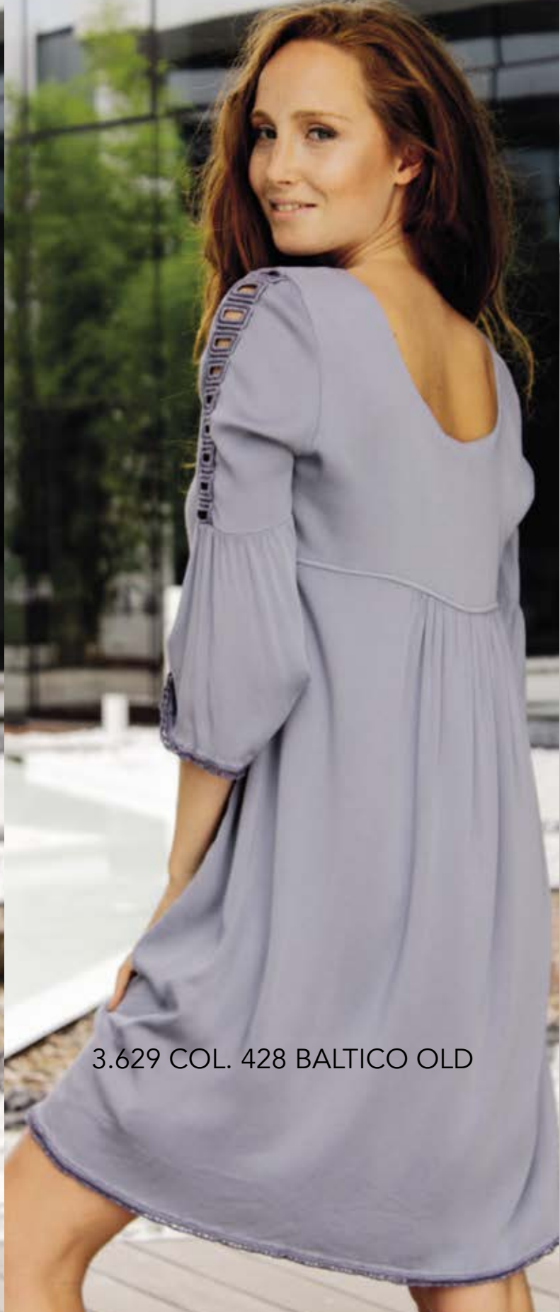
3.629 COL. 428 BALTICO OLD