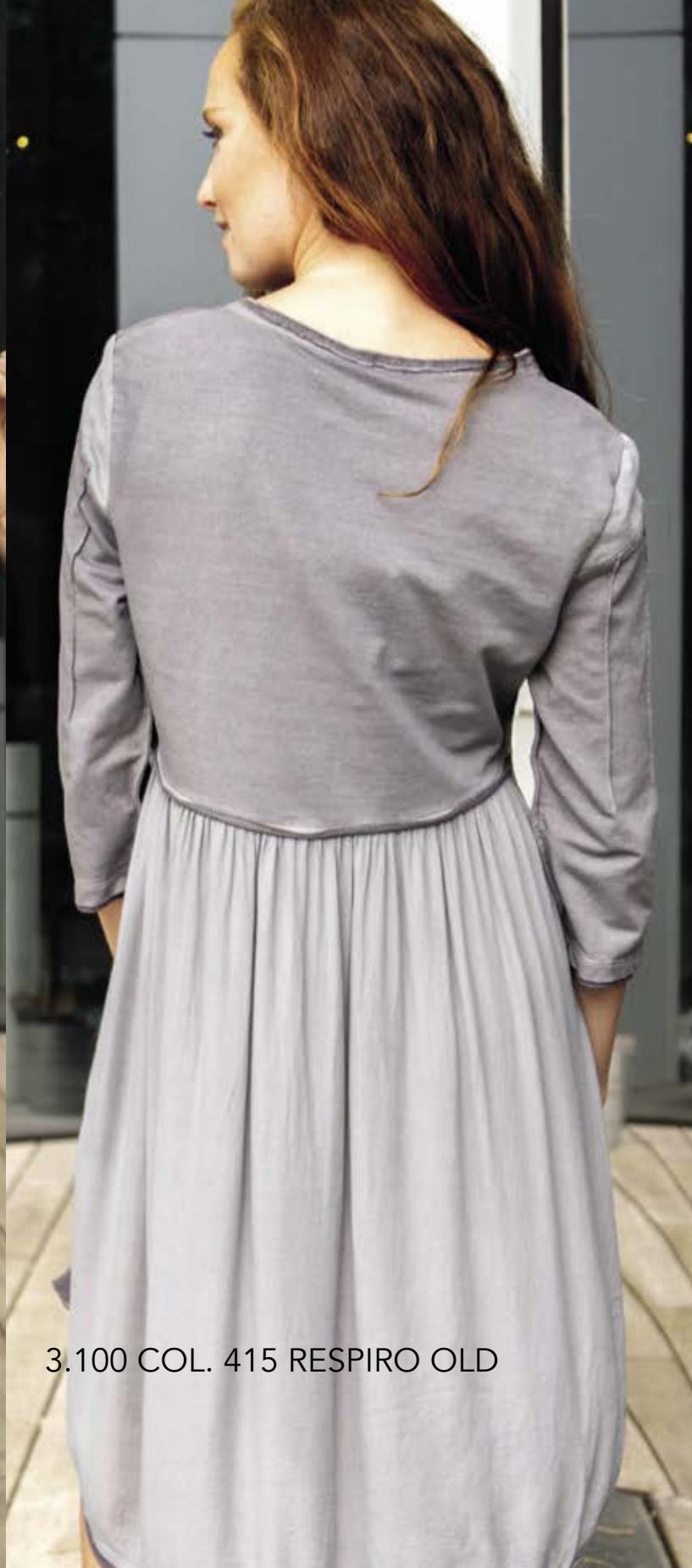
3.100 COL. 415 RESPIRO OLD