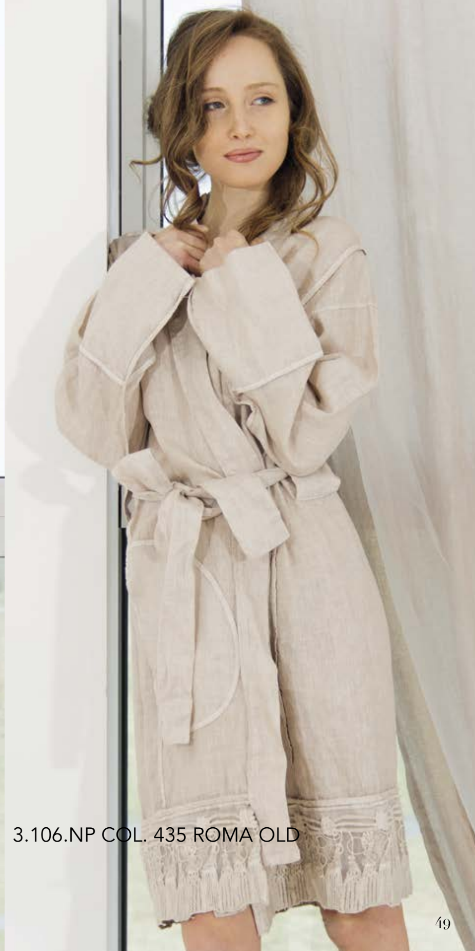
3.106.NP COL. 435 ROMA OLD