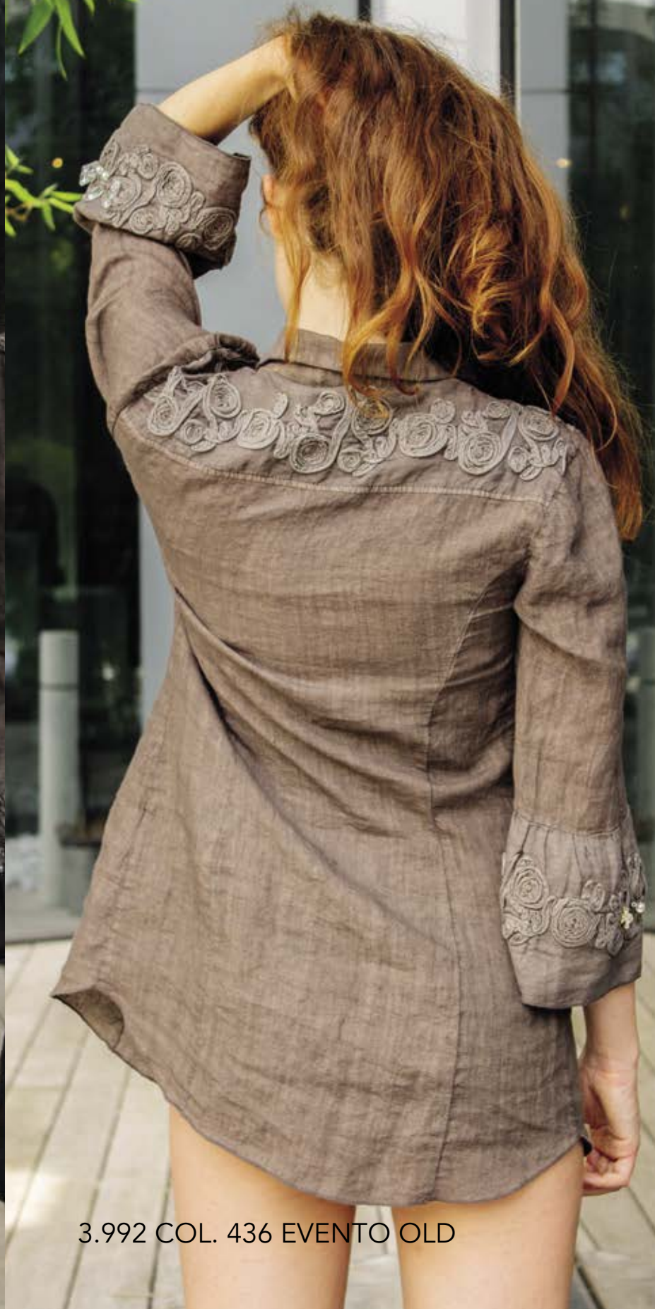
3.992 COL. 436 EVENTO OLD