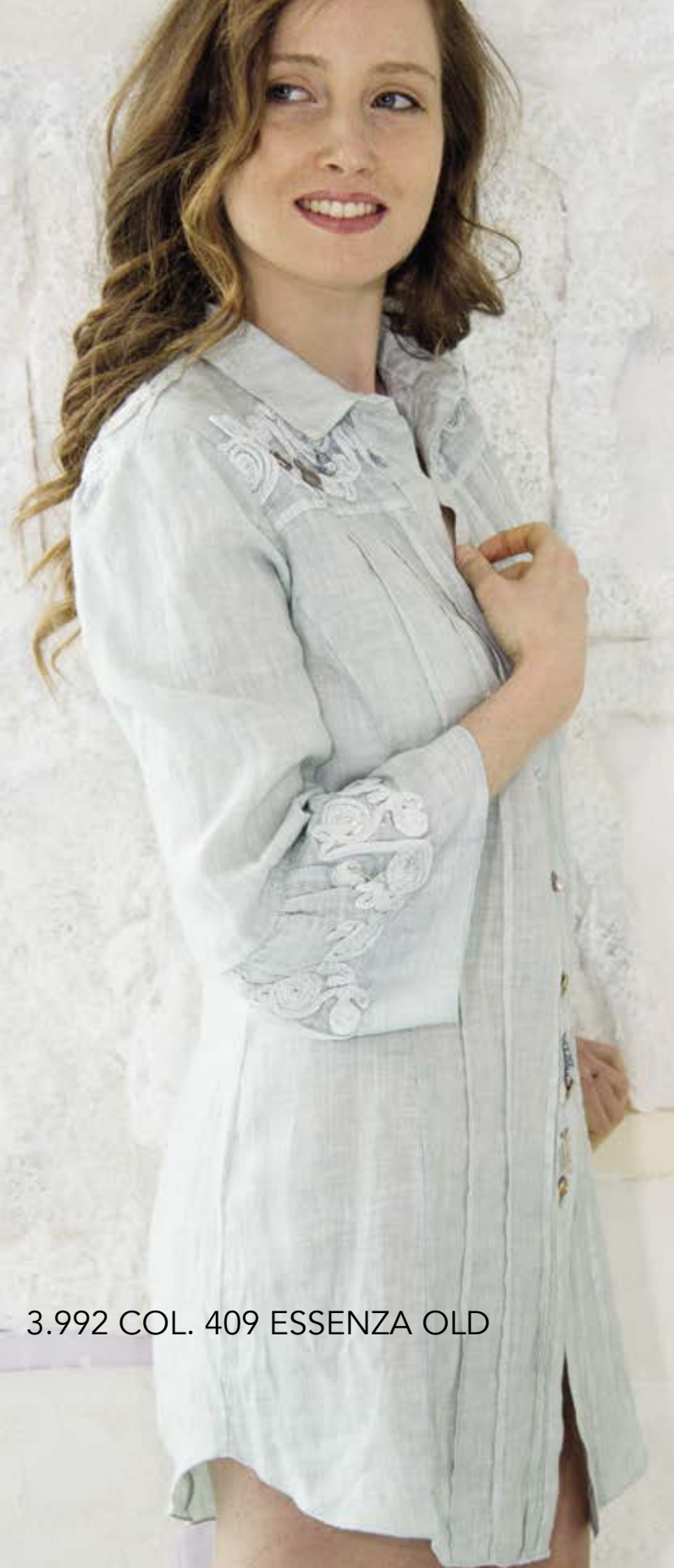
3.992 COL. 409 ESSENZA OLD