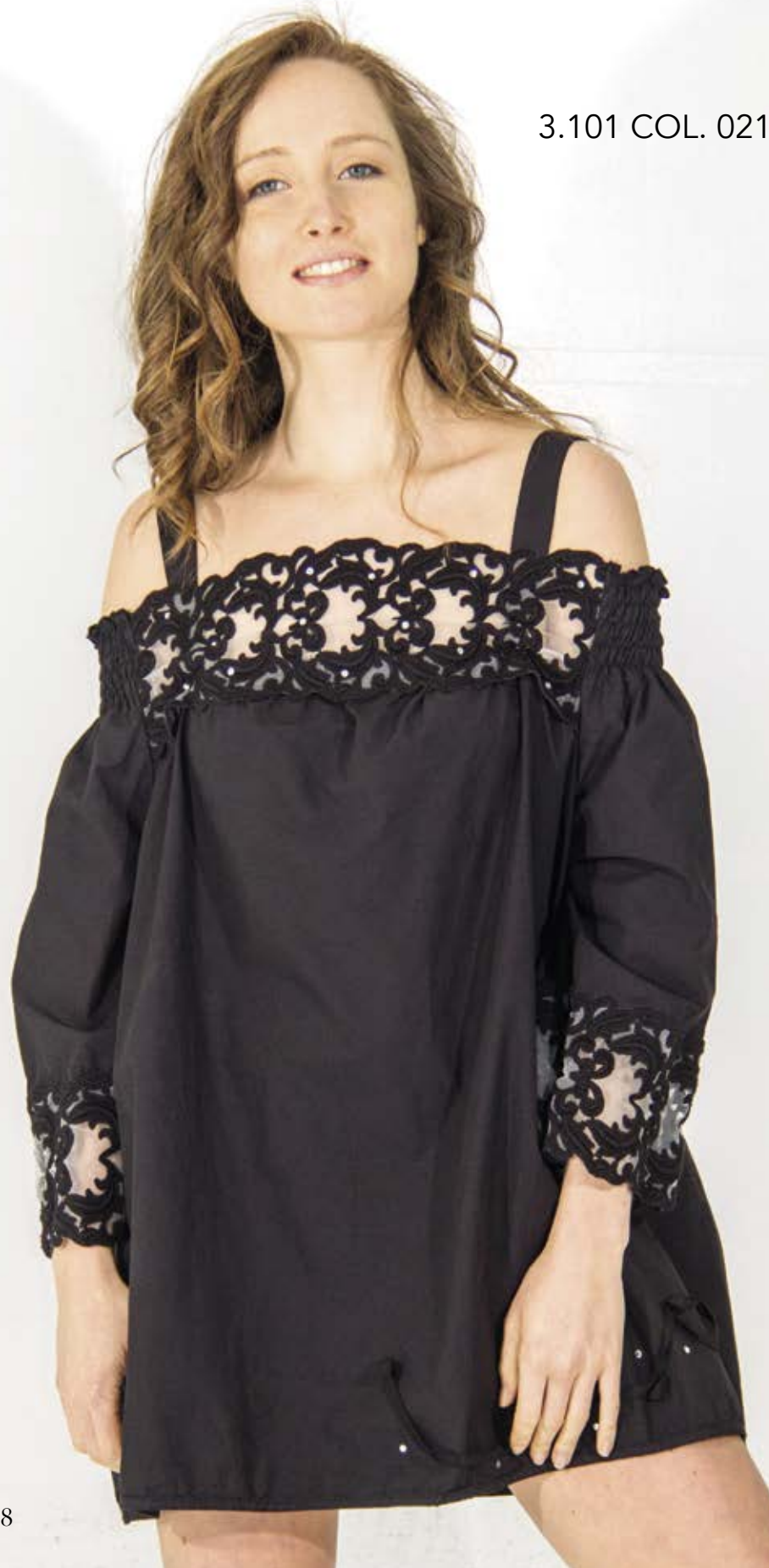
3.101 COL. 021 NERO