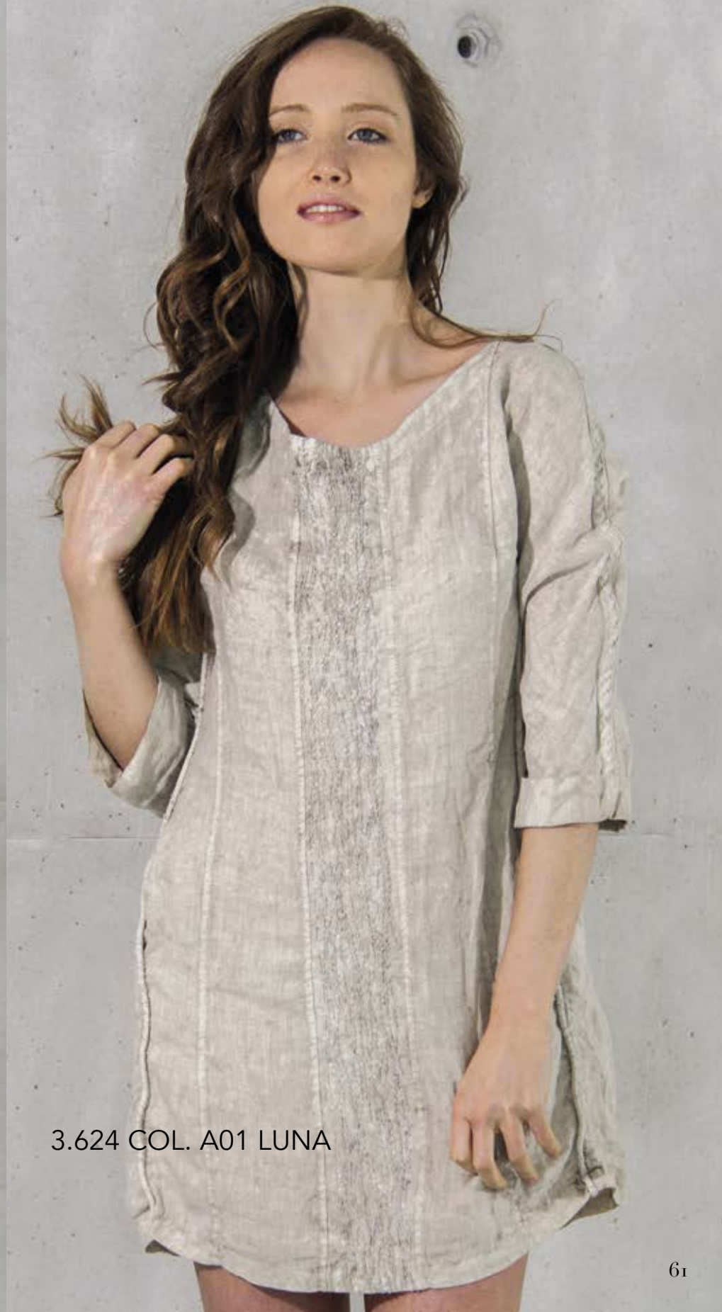
3.624 COL. A01 LUNA