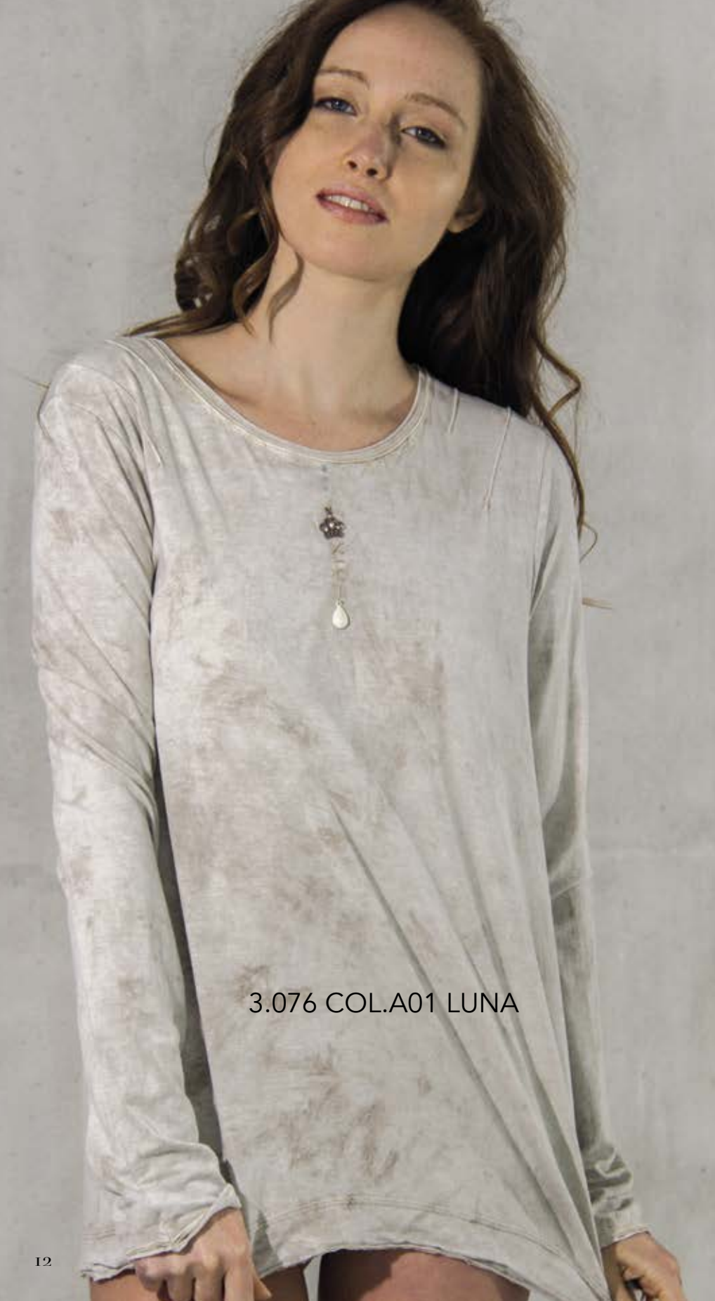
3.076 COL.A01 LUNA