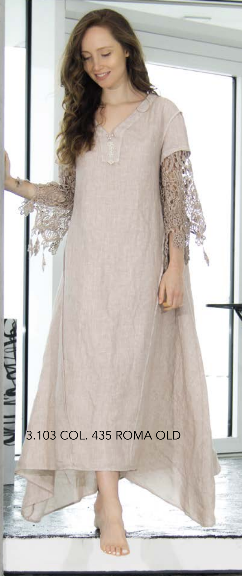
3.103 COL. 435 ROMA OLD