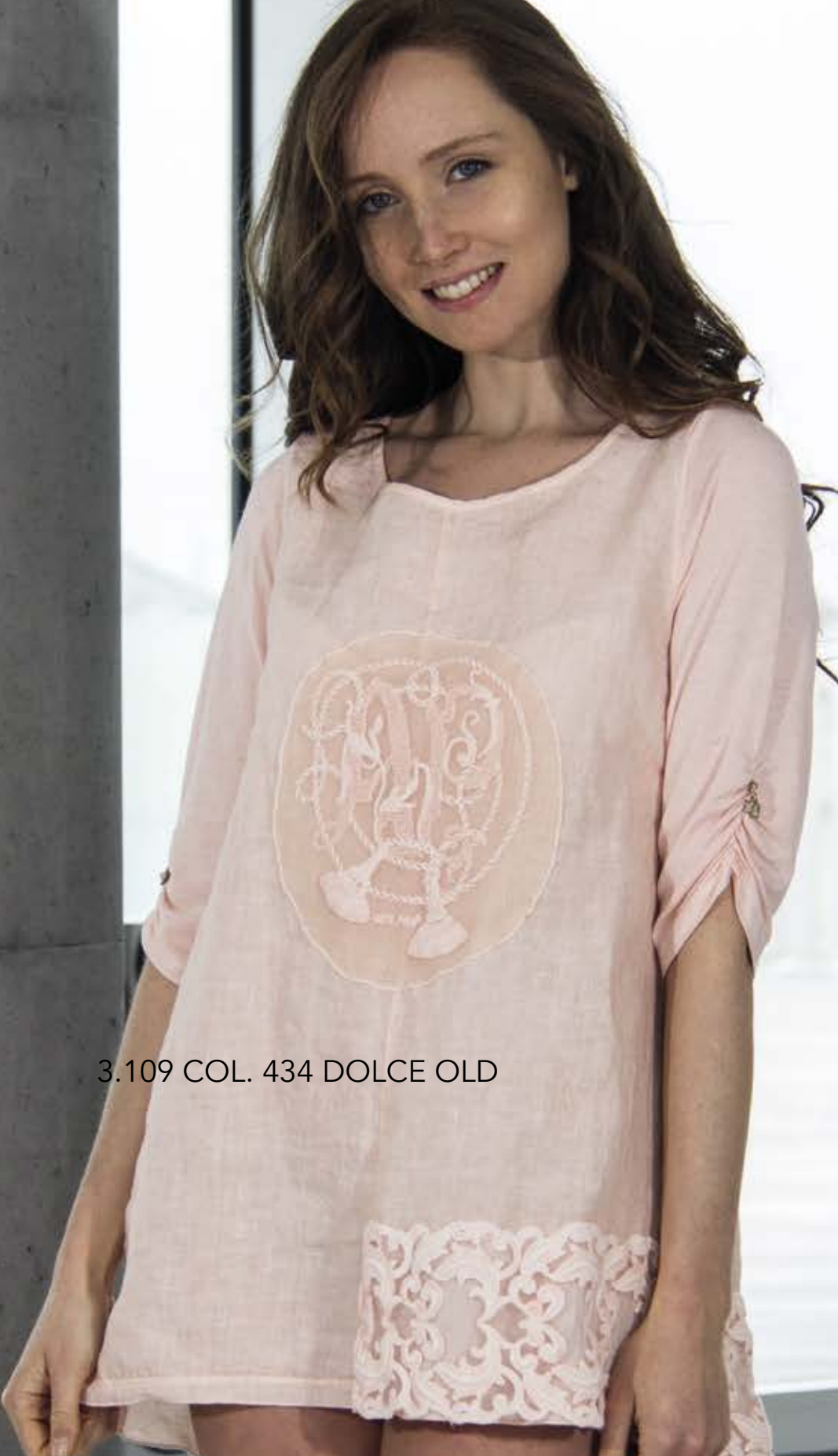
3.109 COL. 434 DOLCE OLD