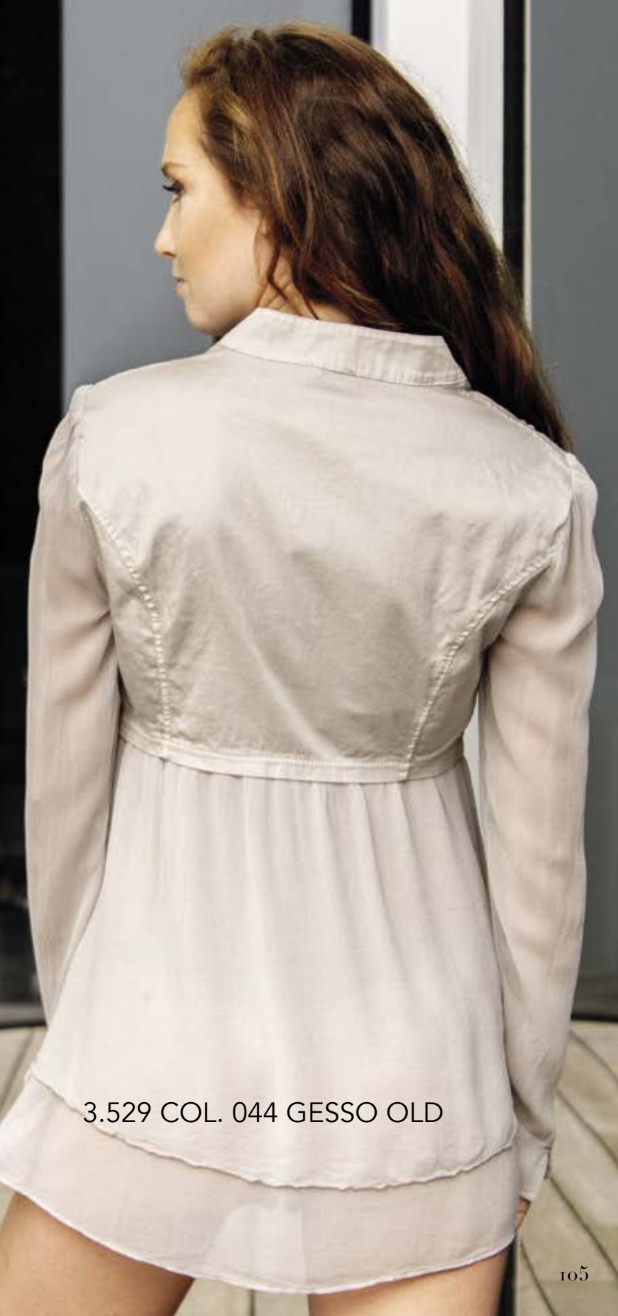
3.529 COL. 044 GESSO OLD