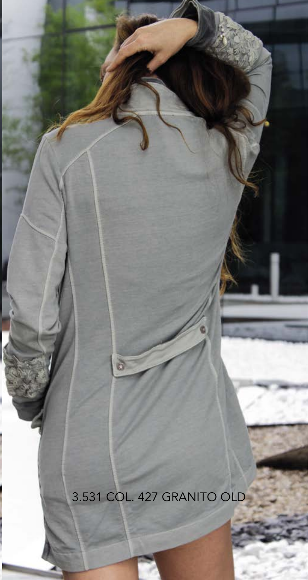
3.531 COL. 427 GRANITO OLD