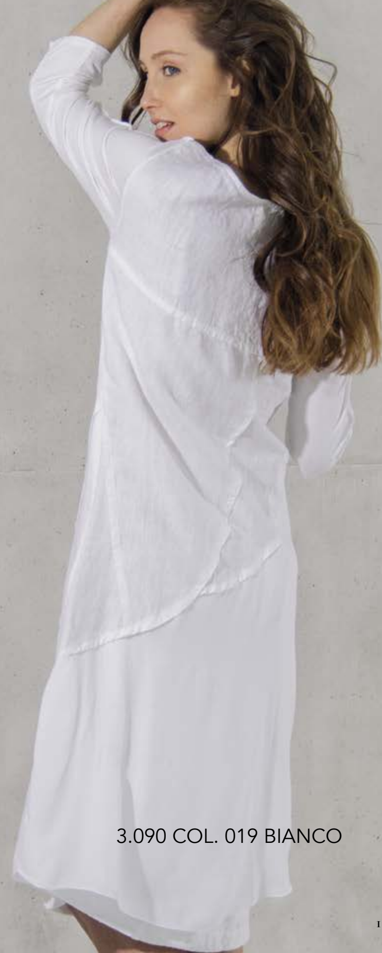
3.090 COL. 019 BIANCO