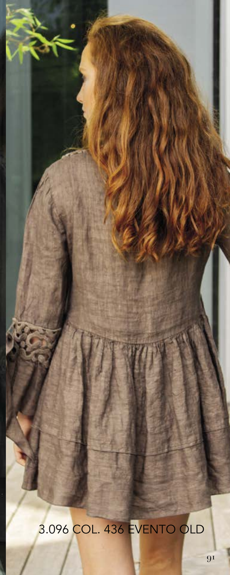
3.096 COL. 436 EVENTO OLD