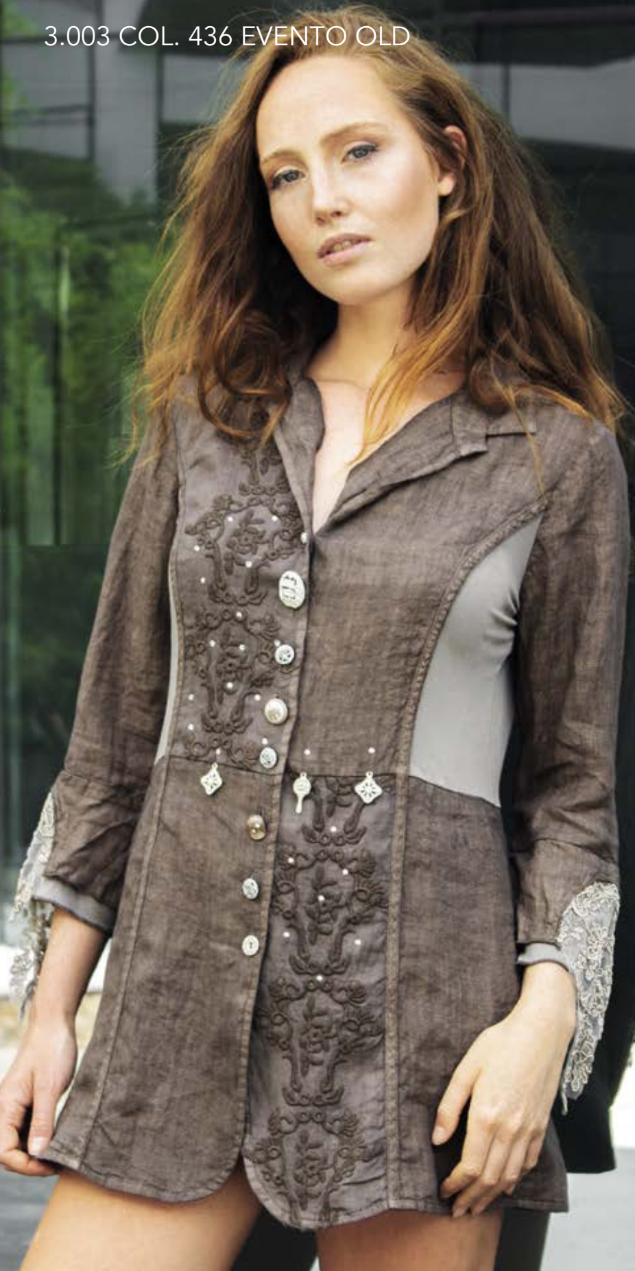
3.003 COL. 436 EVENTO OLD