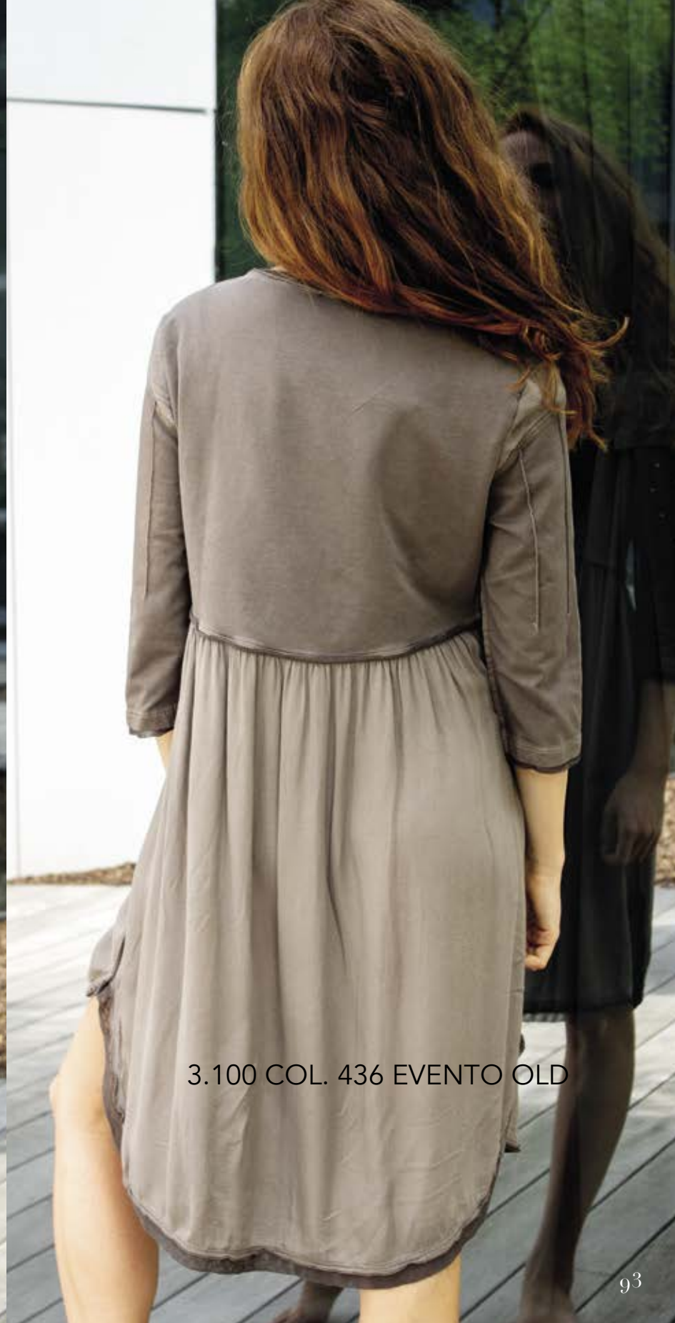
3.100 COL. 436 EVENTO OLD