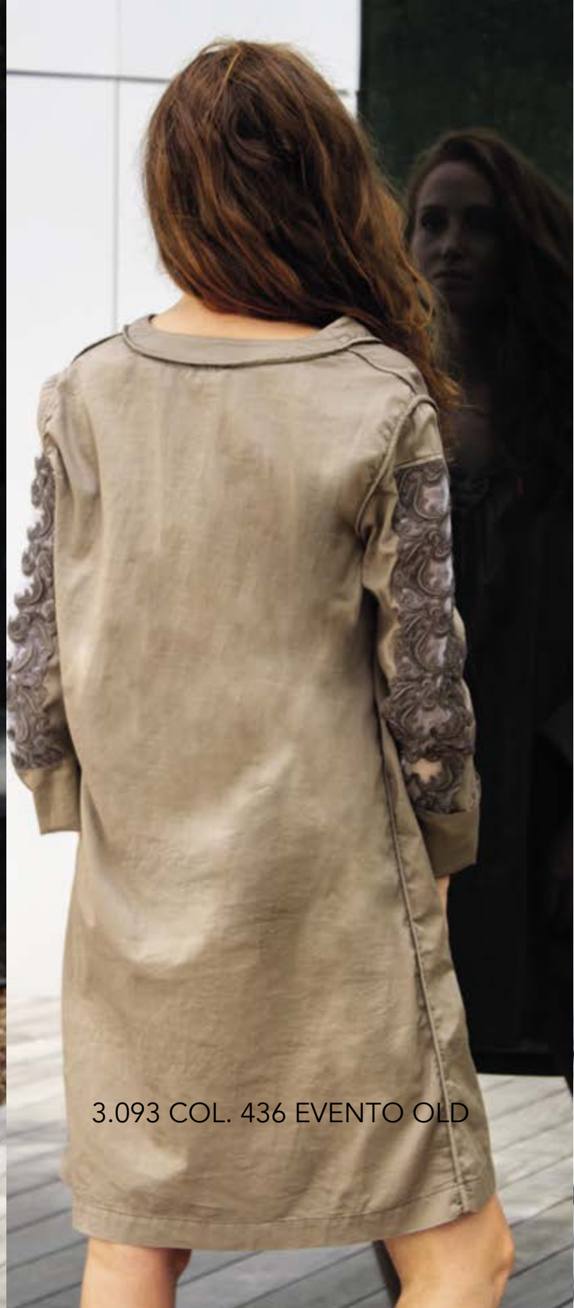
3.093 COL. 436 EVENTO OLD