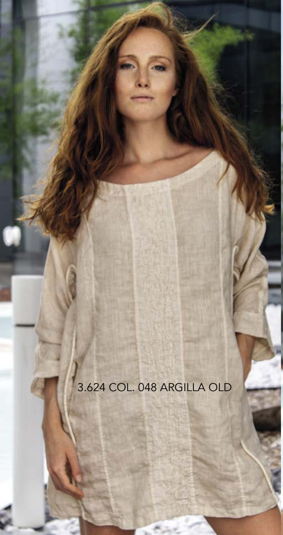
3.624 COL. 048 ARGILLA OLD