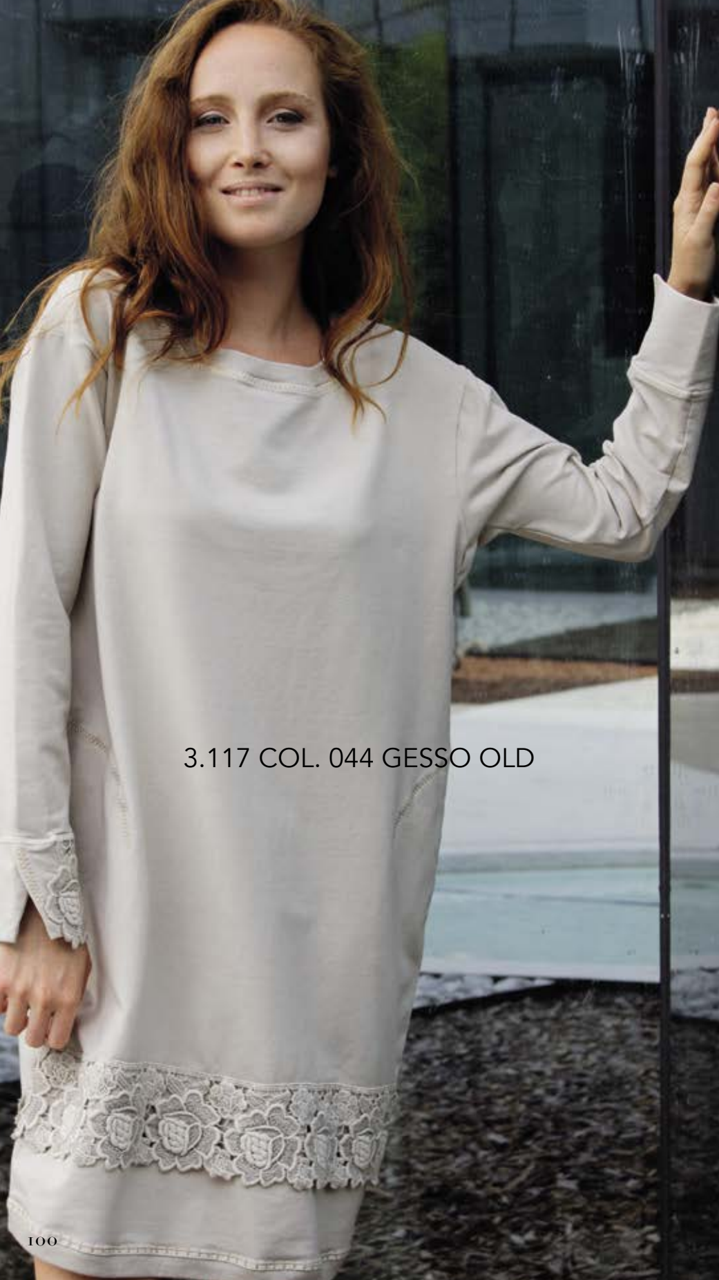
3.117 COL. 044 GESSO OLD