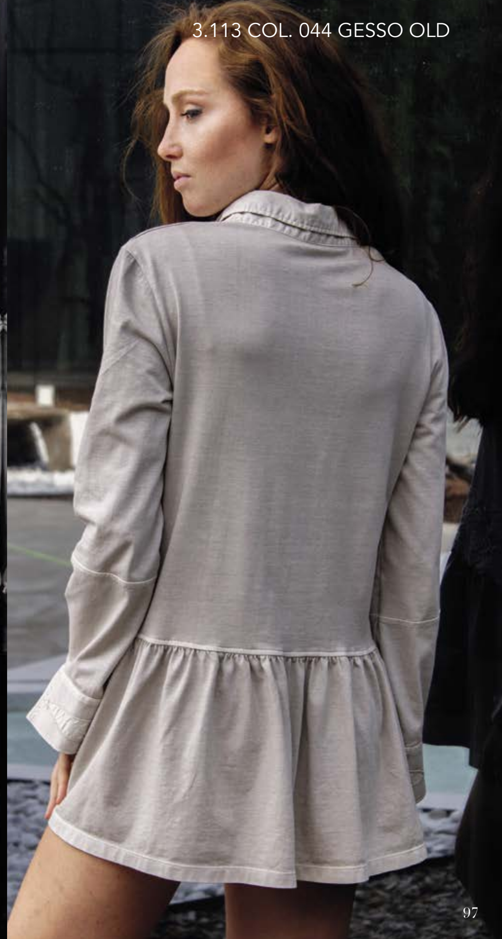
3.113 COL. 044 GESSO OLD