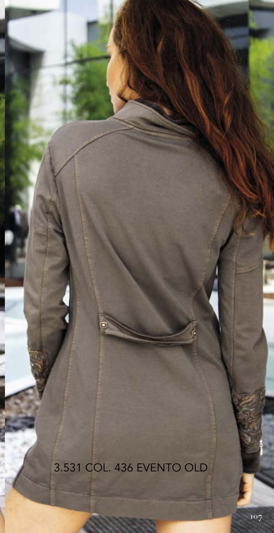
3.531 COL. 436 EVENTO OLD