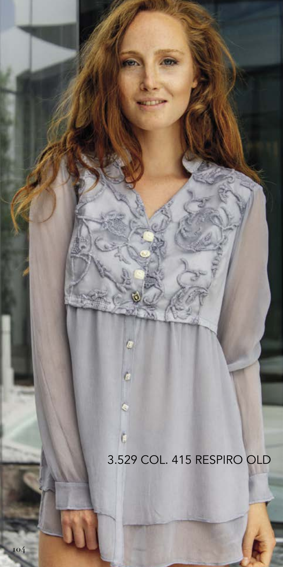
3.529 COL. 415 RESPIRO OLD