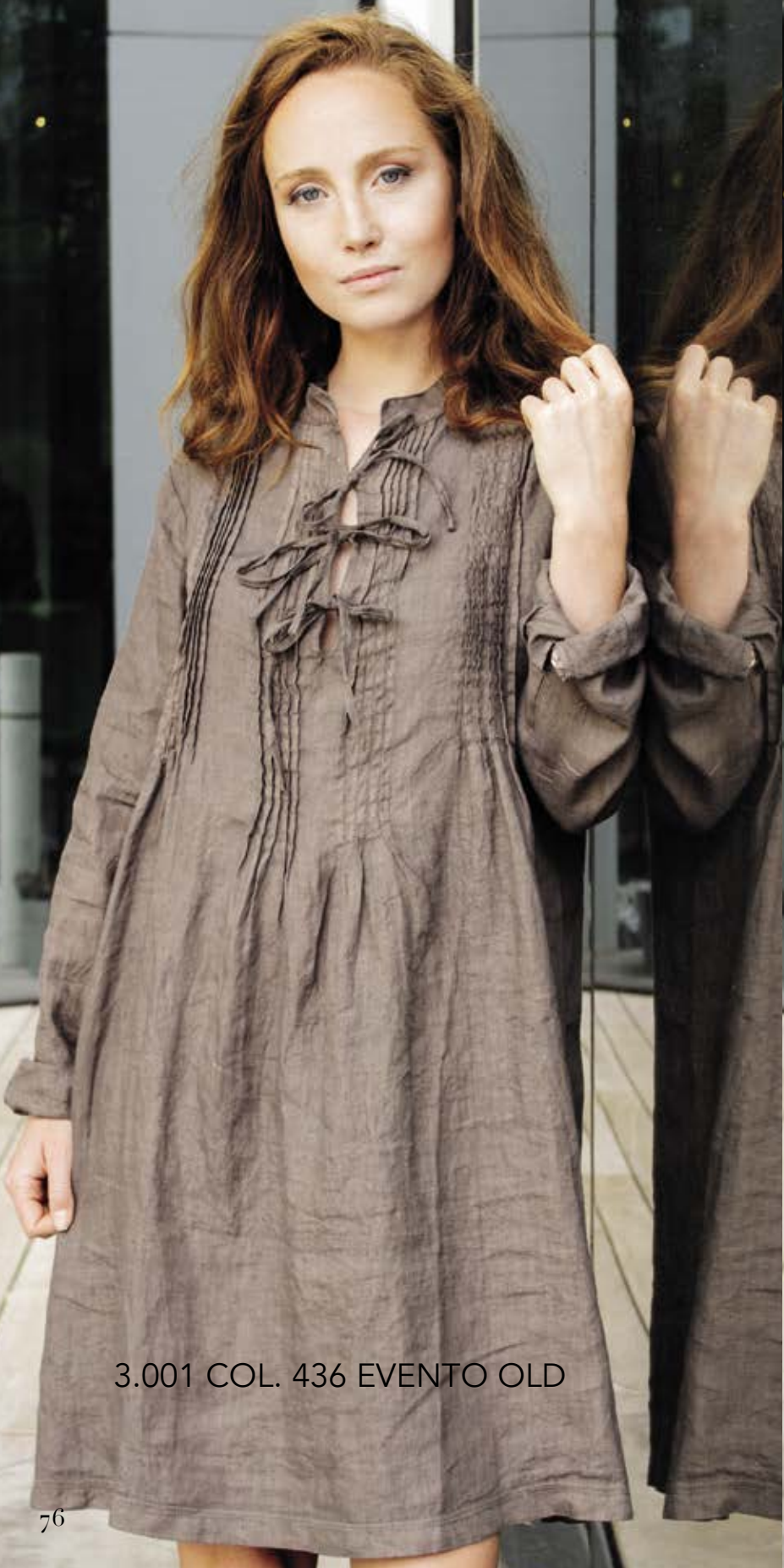
3.001 COL. 436 EVENTO OLD