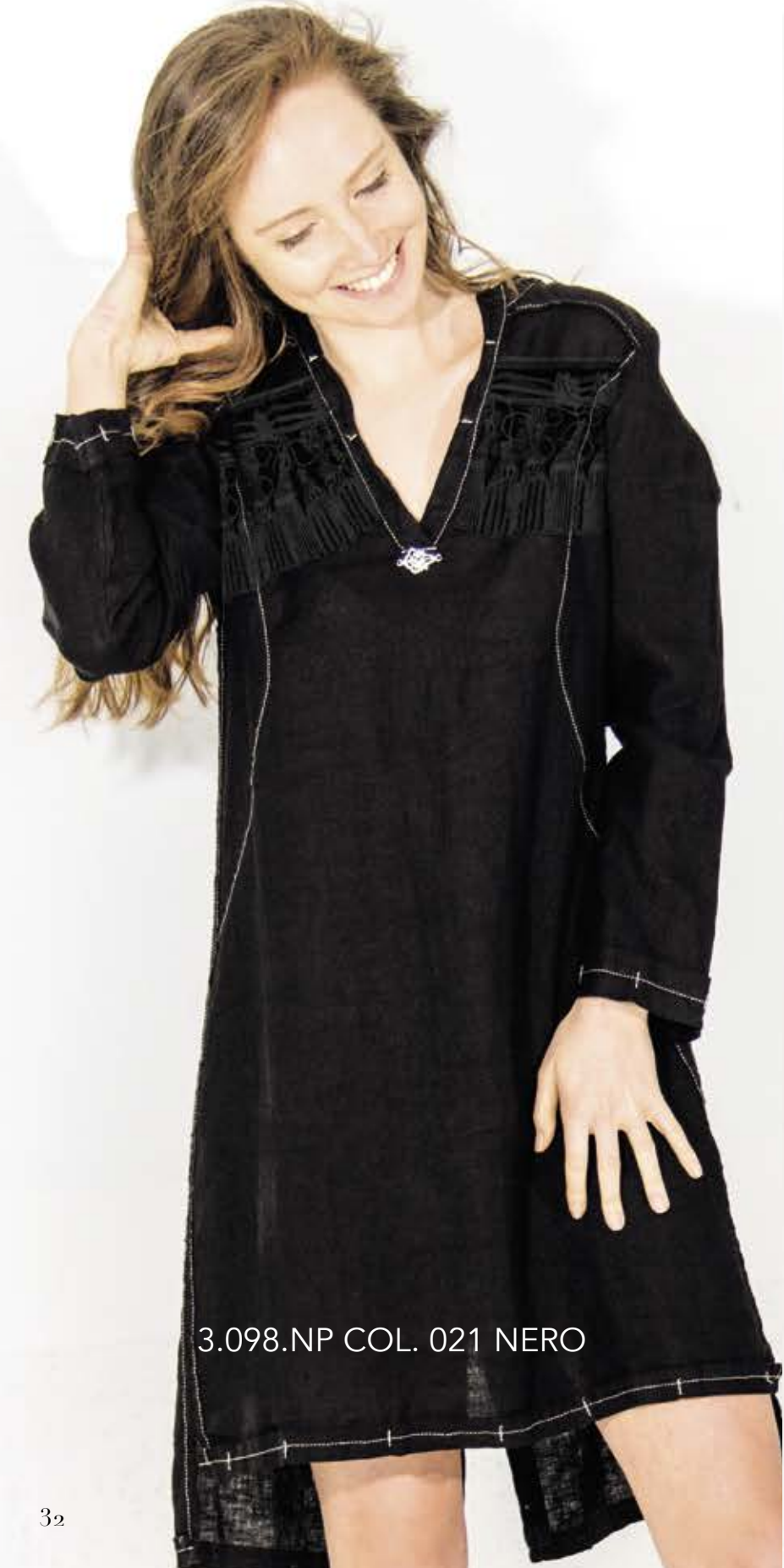
3.098.NP COL. 021 NERO