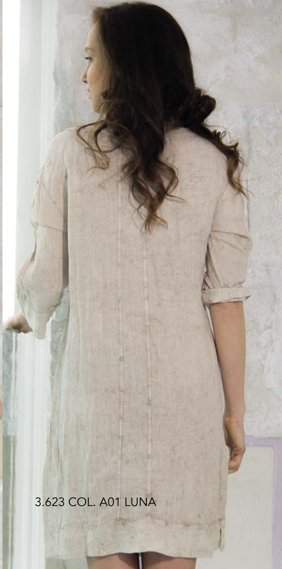
3.623 COL. A01 LUNA