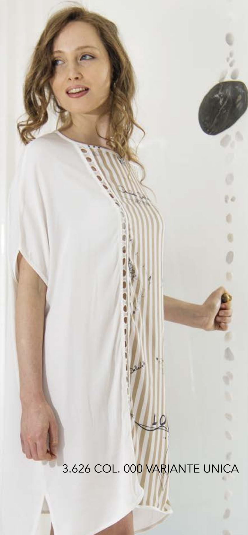
3.626 COL. 000 VARIANTE UNICA