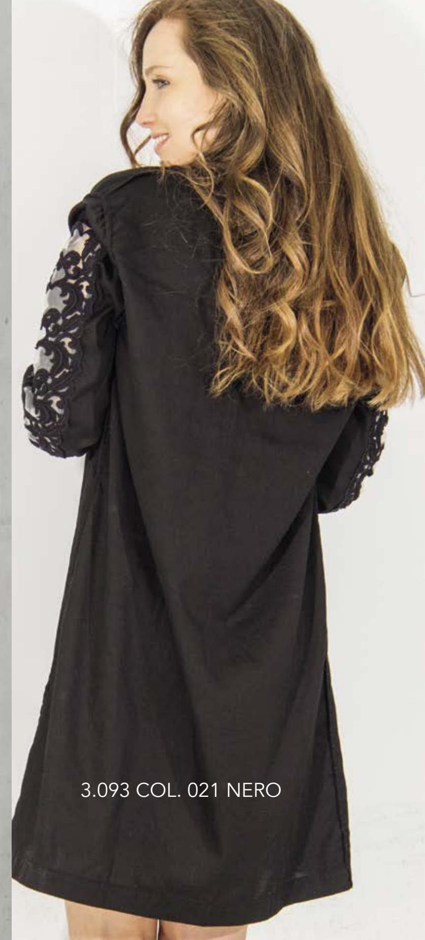
3.093 COL. 021 NERO