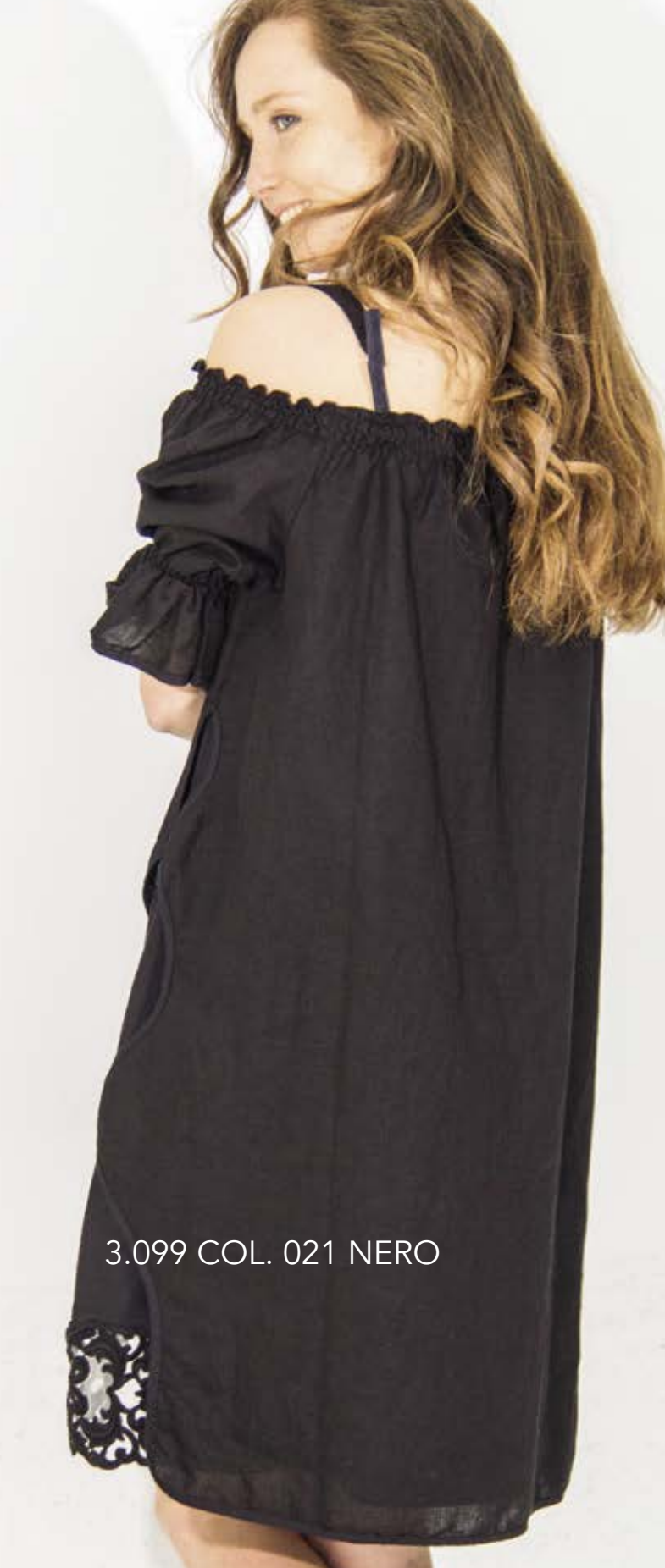
3.099 COL. 021 NERO