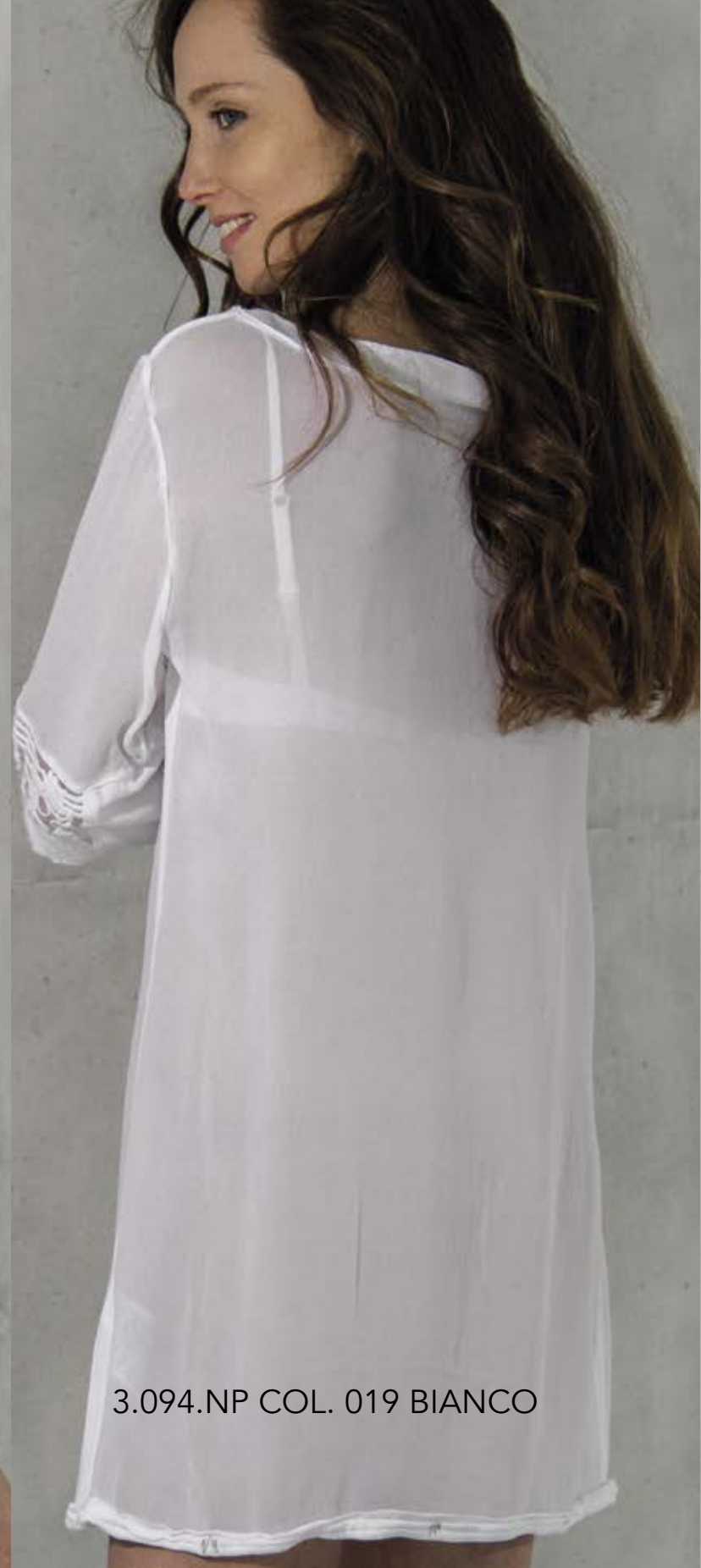
3.094.NP COL. 019 BIANCO