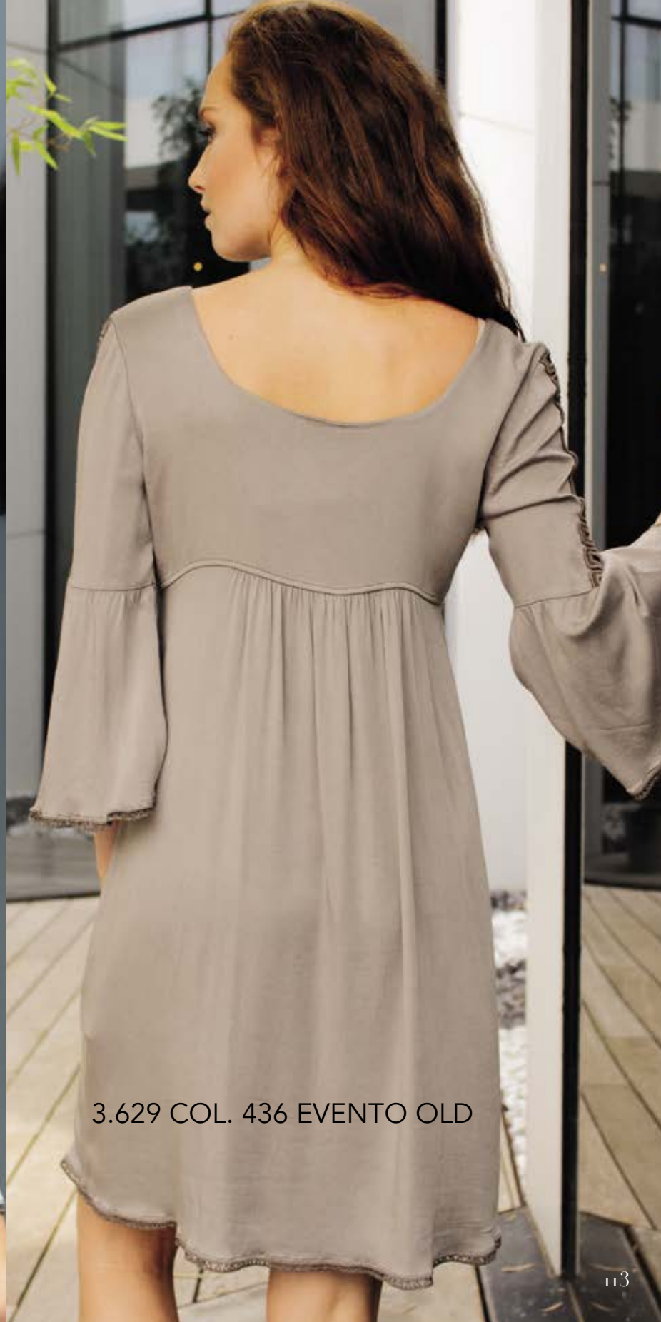
3.629 COL. 436 EVENTO OLD