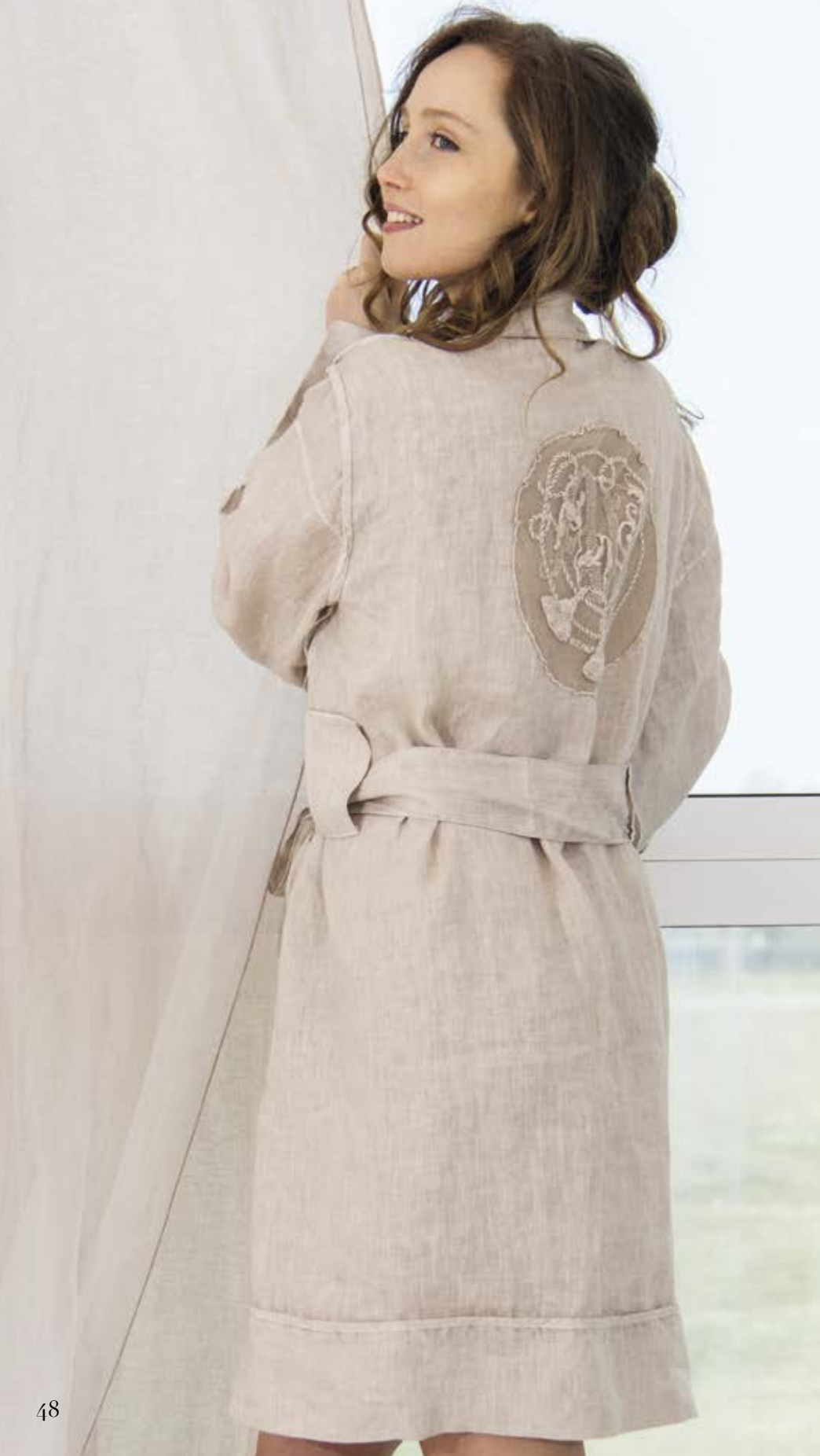
3.106 COL. 435 ROMA OLD