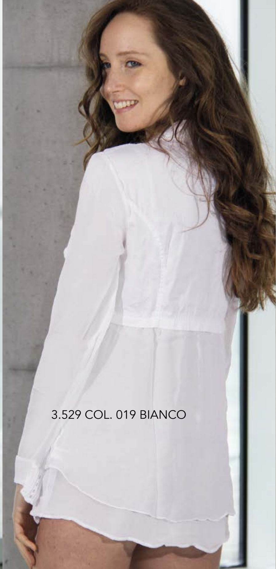
3.529 COL. 019 BIANCO