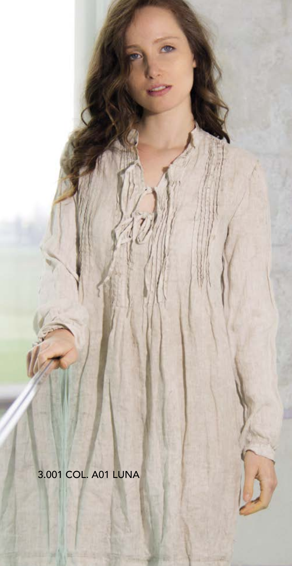
3.001 COL. A01 LUNA