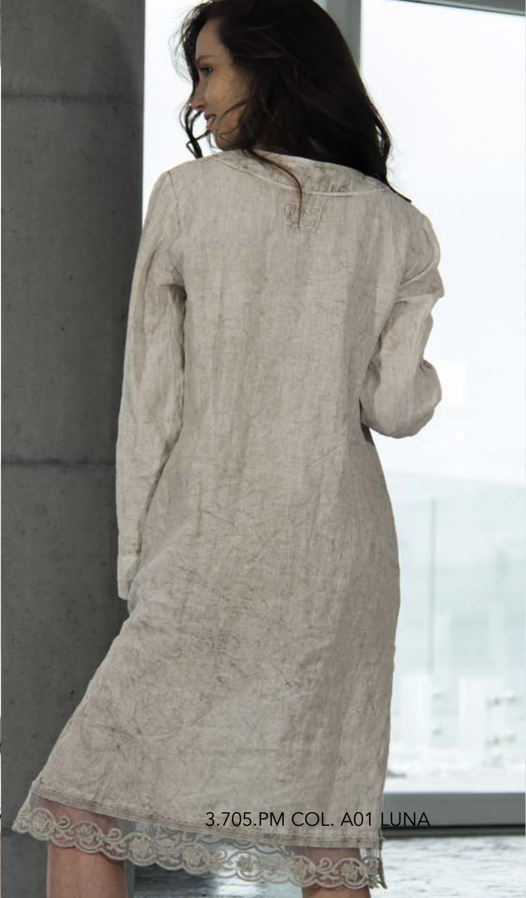
3.705.PM COL. A01 LUNA