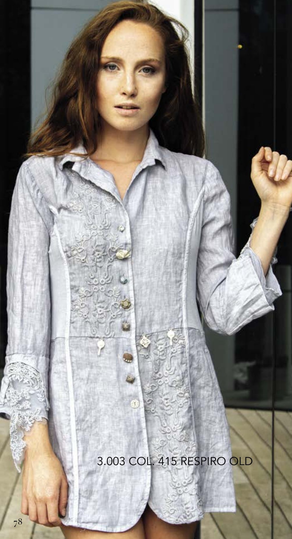
3.003 COL. 415 RESPIRO OLD