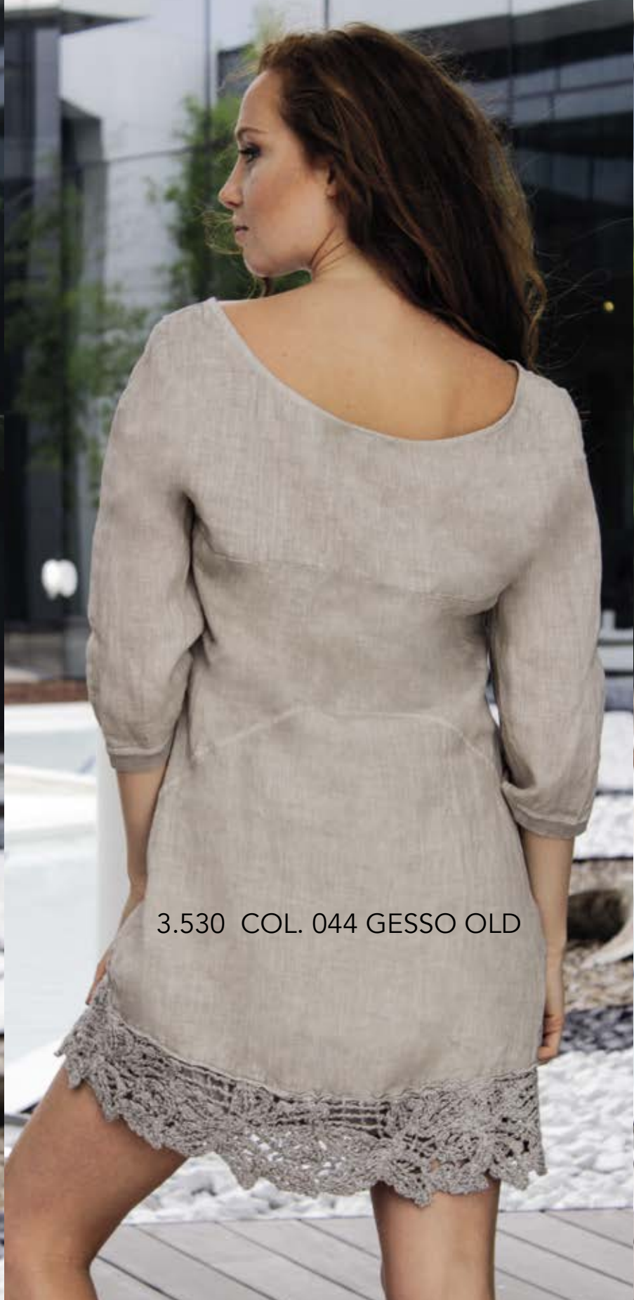
3.530 COL. 044 GESSO OLD